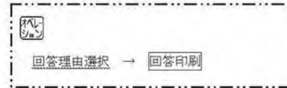
<オンライン申請画面>

3) 回答入力画面が表示されるので、回答理由を選択し、「回答印刷」ボタンをクリックします。